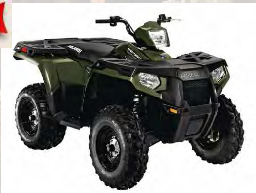
Sportsman 400 HO Le moteur 454 cc HO carbu mis dans un chassis "full size"