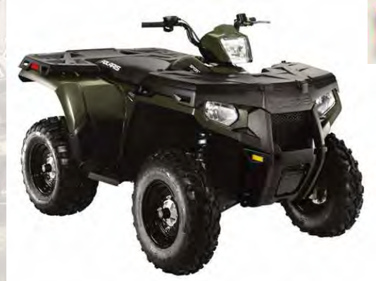
Sportsman 500 HO - 8,6 kg vs modèle 2010 Coffre avant Lock & Ride de série Homologation USA