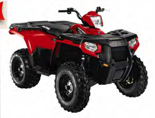
Sportsman 800 EFI -13 kg vs modèle 2010 Homologation USA