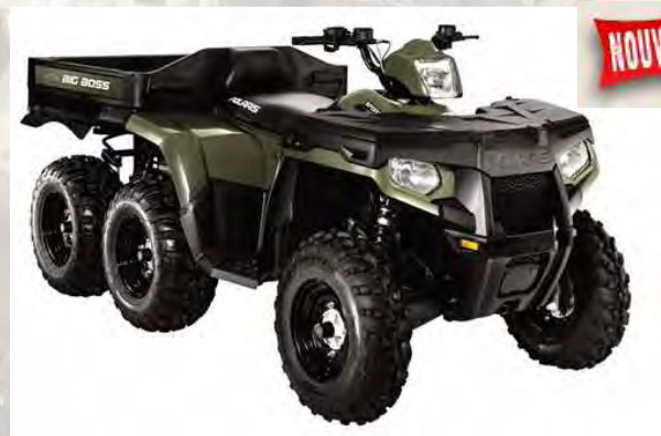
Sportsman 800 6x6 big boss: Coffre avant Lock & Ride de série